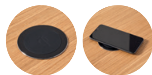
– Wireless induction charger Cargador inalámbrico por inducción