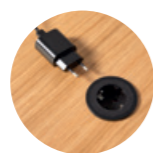
– On top schuko socket Enchufe de sobremesa