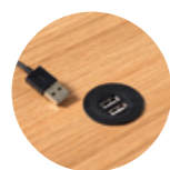
– USB charger with 2 ports Cargador USB con dos puertos