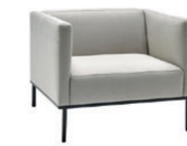
– Armchair 80 cm w/ high arms Butaca 80cm con brazos altos