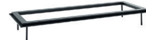
– Aluminum frame Estructura de aluminio 80cm / 120cm / 160cm / 200cm / 240cm / 280cm / 320cm / 360cm