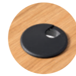
– Plastic cable grommet with cover Pasacables redondo con tapa de plástico