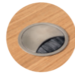
– Brushed aluminum grommet with cover Pasacables redondo con tapa de aluminio cepillado