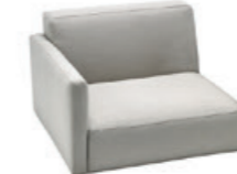
– Seat 80cm w/backrest & low arm Asiento 80cm con respaldo y brazo bajo