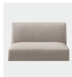
– Plain upholstery Tapizado liso