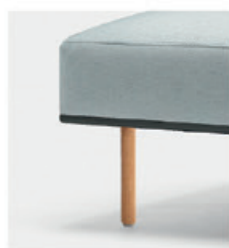
– Wooden leg Pata de madera