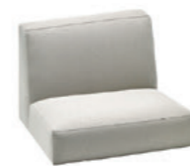
– Seat 80cm w/high backrest Asiento 80cm con respaldo alto