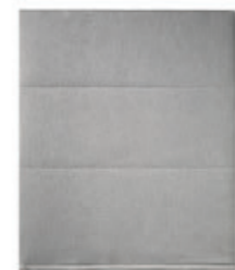
– Privacy screens Paneles de privacidad