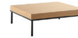
– Low table 80x80cm Mesa baja 80x80cm