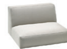
– Seat 80cm w/backrest Asiento 80cm con respaldo