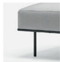
– Metal leg Pata metálica