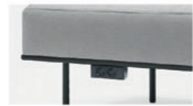
– Power box with 2 schuko sockets Caja con 2 enchufes schuko