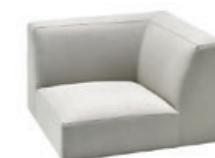
– Seat 80cm w/ corner backrest Asiento 80cm con respaldo rinconera