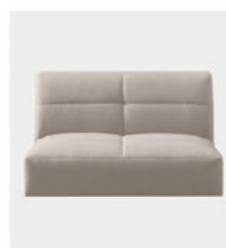
– Quilted upholstery Tapizado acolchado