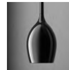
Glossy Black glass