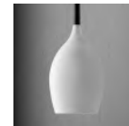
Glossy White glass