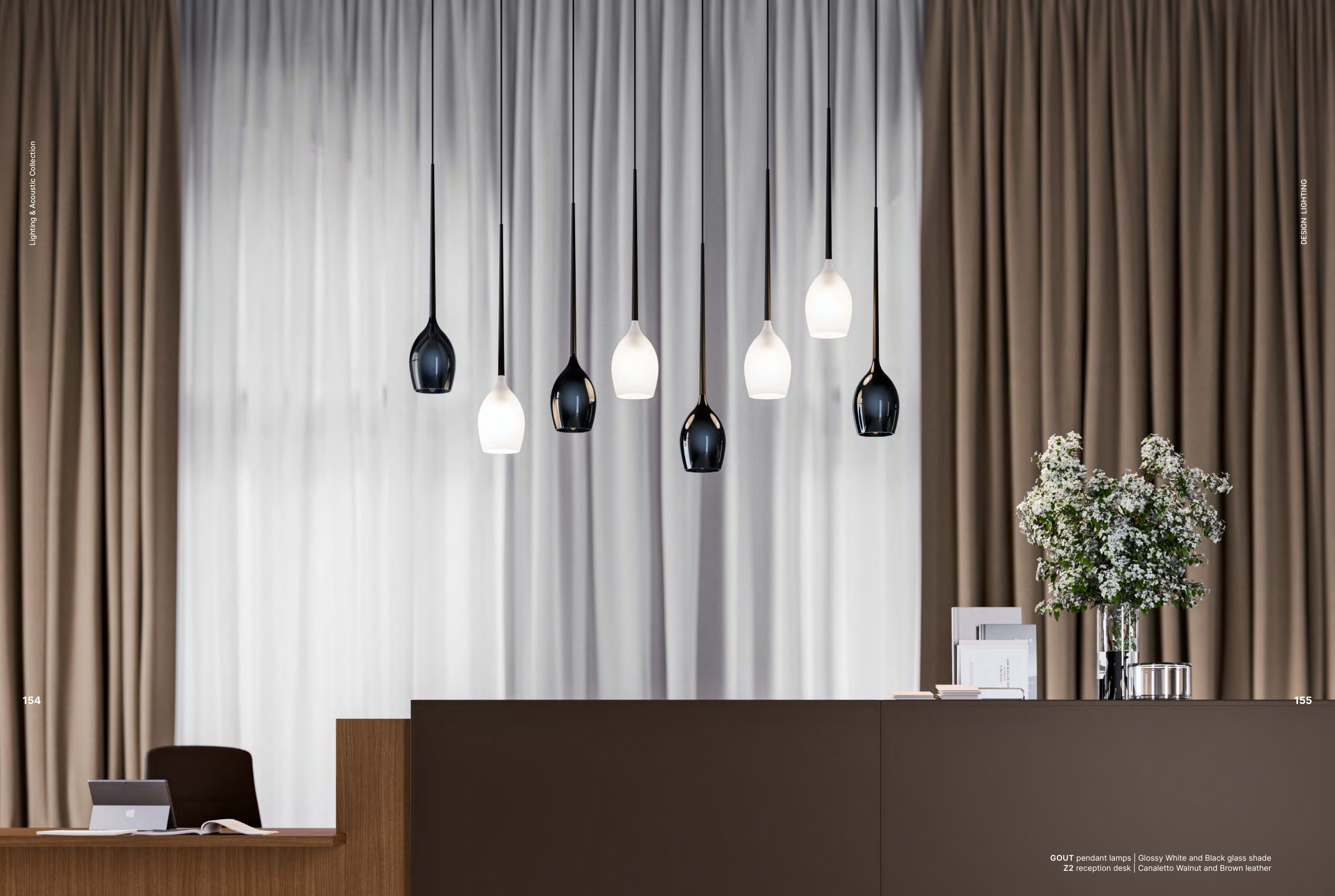
GOUT pendant lamps | Glossy White and Black glass shade Z2 reception desk | Canaletto Walnut and Brown leather